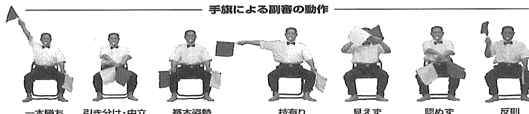
手旗による副審の動作